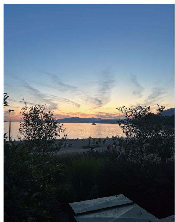
イングリッシュベイ

私は4泊6日でカナダのパンクーパーへ旅行に行きました。初めての英語圏なので緊張していましたが、現地には留学している従妹がいて安心して過ごすことができました。パンクーパーは日本とは違い、ほとんどの人がマスクをしていなかったため完全にアフターコロナの状態でした。