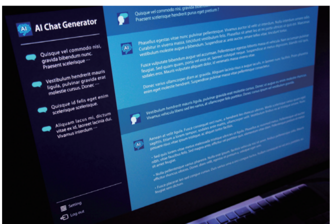
AI Chat Generatorの画面