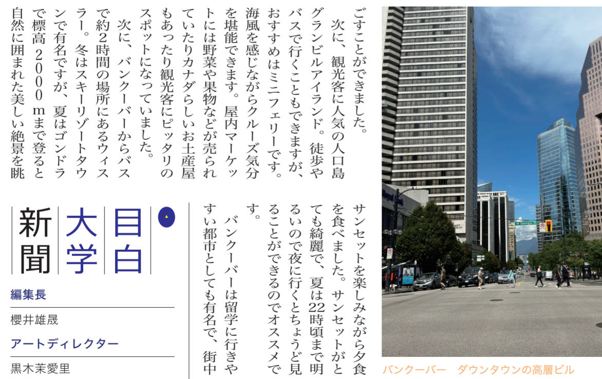
パンクーパー ダウンタウンの高層ビル