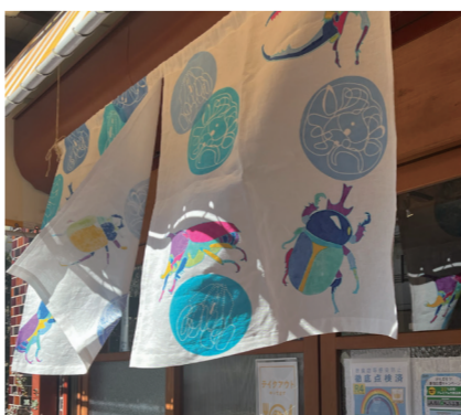
中井の飲食店「カプトムシ」の暖簾

昼頃には一段と人が増え、良い天気で迎えた最終日を彩る雰囲気は、より一層コロナが終息しつつあることを実感させてくれました。