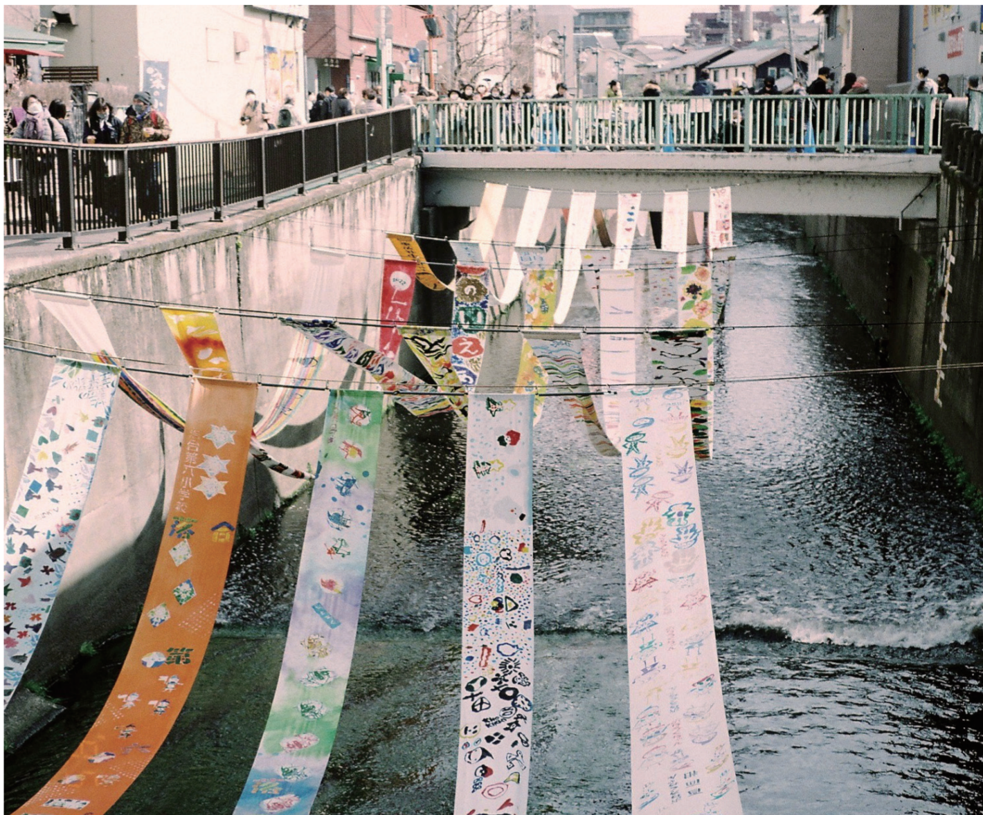
妙正寺川に展示された反物「川のギャラリー」