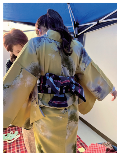
着付け中のメディア学部生

私はそういうことに関わる機会はないです。でも私自身着物が好きで、YouTubeなどで外国の記憶しかないみたいなのが多いので、なるべく苦しくないように着方や、インドのサリーの着